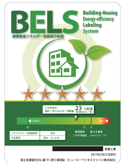
▲弊社 BELS 認証ラベル事例