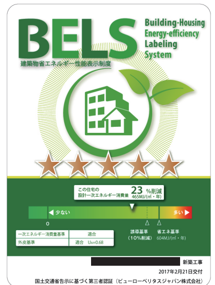
▲弊社 BELS 認証ラベル事例