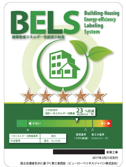
▲弊社 BELS 認証ラベル事例