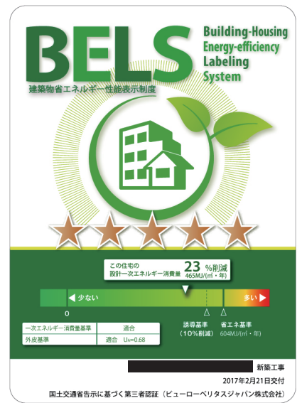
▲弊社 BELS 認証ラベル事例