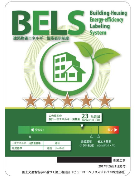
▲弊社 BELS 認証ラベル事例